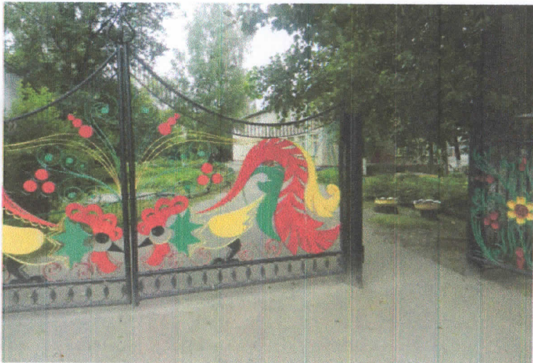
Вход через ворота