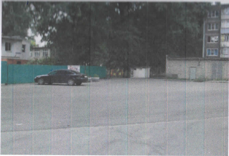
Проезжая часть перед учреждением