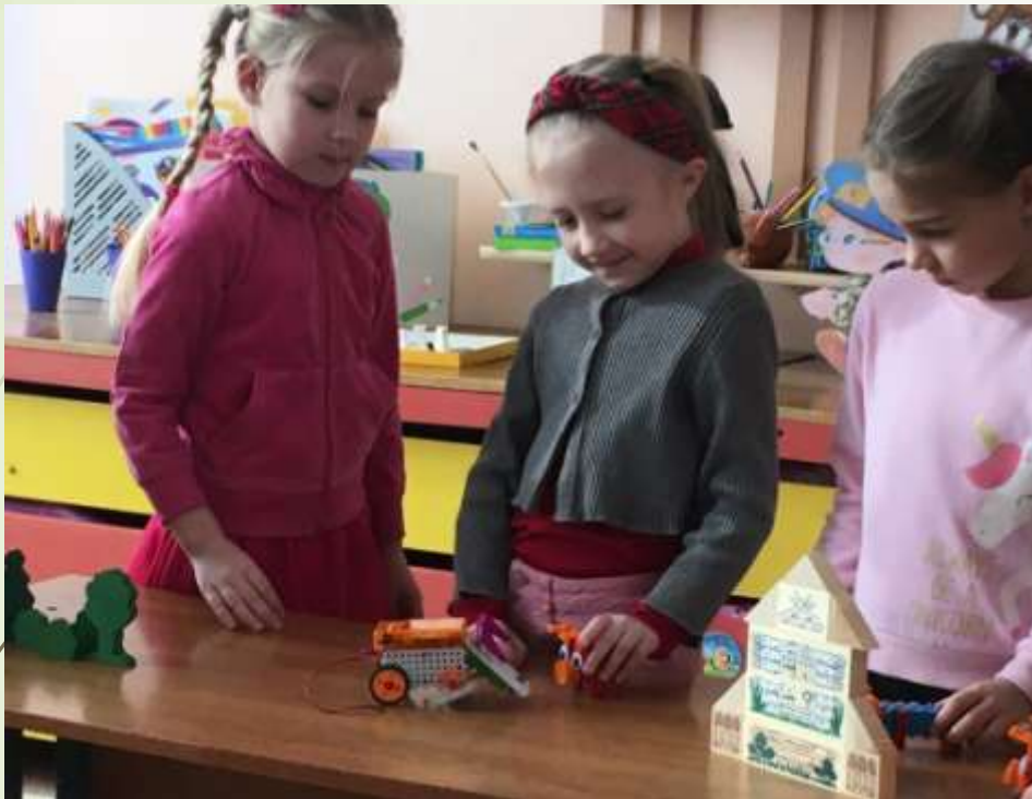
Хочу стать конструктором