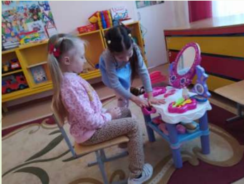
Моя мама - парикмахер