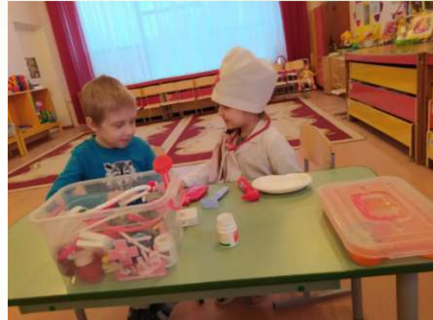
Мой папа - врач